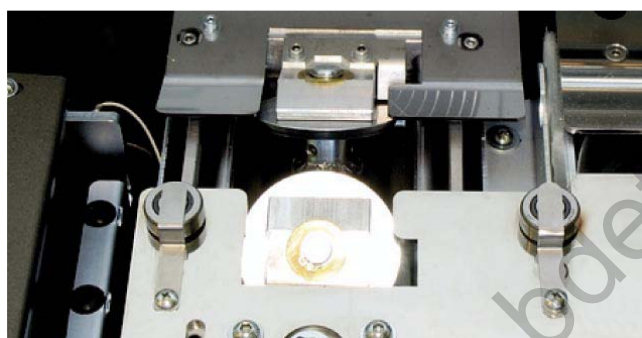
Bac EVA pour collage latéral