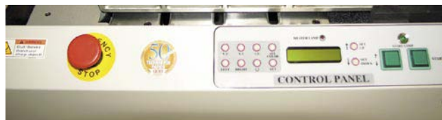
Tableau de commandes