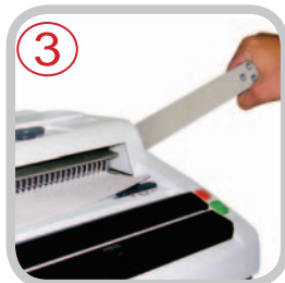
3 Mécanisme de Fermeture