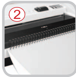
2 Support des peignes