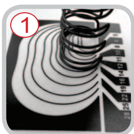
1 Sélecteur des reliures