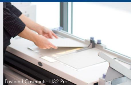
Fastbind Casematic H32 Pro

Fastbind Secura peut combiner avec les Casemakers pour un résultat de haute qualité professionnelle.