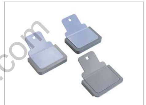
Deux guides aimantés pour maintenir la couverture et un guide pour le bloc.

Le Fastbind FotoMount F46e™ est idéalement conçu pour les studios photo, les mini labs et les photographes professionnels. Il répond également aux exigences des imprimeurs numériques, copy-centres et éditeurs à la demande. Leur priorité est d'offrir des albums à la hauteur de leur professionnalisme.