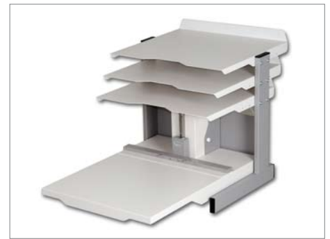
Matériel de table compact.

Le Fastbind FotoMount F46e™ est un équipement électrique pour monter des albums grand format de 50 x 50 mm jusqu'à 457 x 457 mm (18" x 18"). Il est muni du système breveté Fastbind Mountinglift™. Il opère à l'aide d'une pédale, libérant ainsi vos mains pour les dédier au positionnement des photos. Il en résulte une productivité plus importante. Vous retrouvez votre liberté dans le choix de vos papiers. Vos images gardent leur continuité offrant une vue panoramique splendide. Vous utilisez soit une couverture prête à l'emploi ou confectionnez vous-même une couverture personnalisée.* En quelques minutes, vous concevez un album somptueux hautement professionnel. Votre temps de travail est réduit et vos bénéfices augmentent.